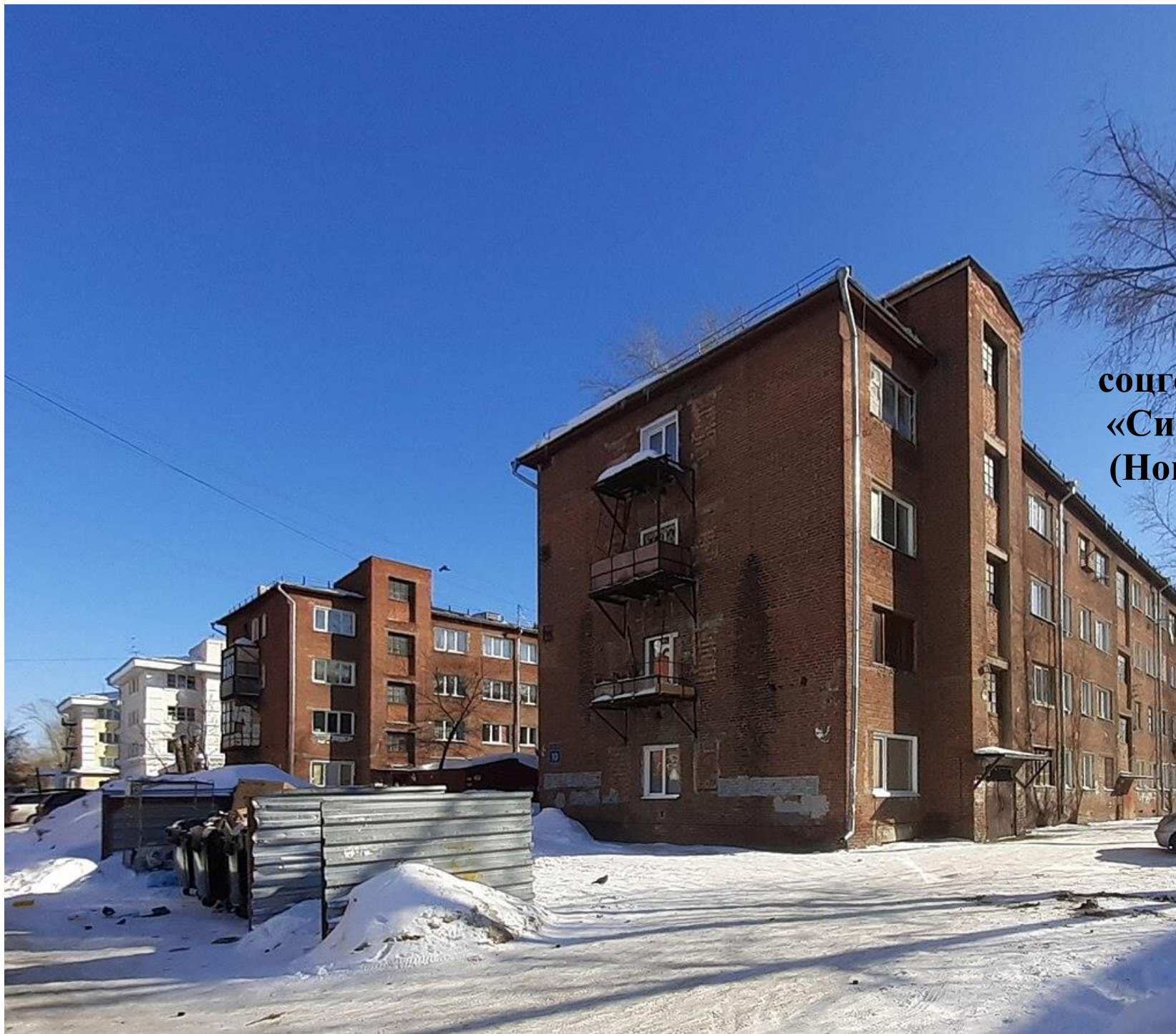
соцгород завода «Сибсельмаш» (Новосибирск)