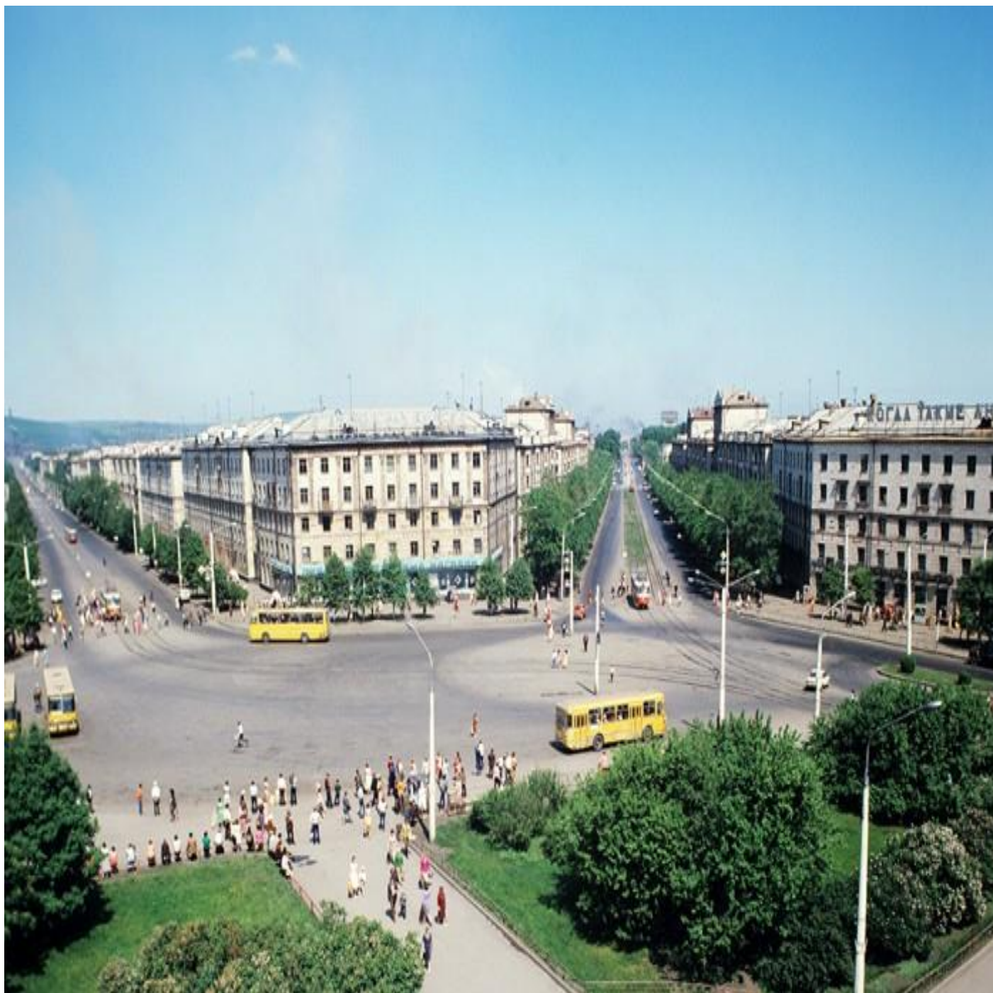
социалистический город Магнитогорска